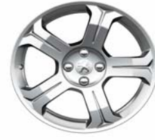
Jante alliage Licancabur 18"