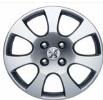
Enjoliveur Toliman 16"