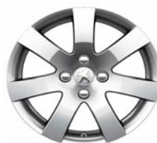
Jante alliage Santiaguito 16"