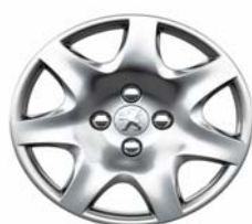
Enjoliveur Pacaya 15"

** Option Gratuite sur Féline (inclus avec la prise d'option Roue de secours homogène alliage)