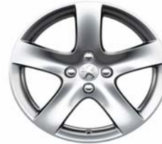
Jante alliage Rinjani 17"