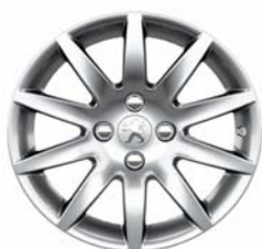
Jante alliage Izalco 16"