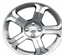
Jante alliage Lincancabur 18"