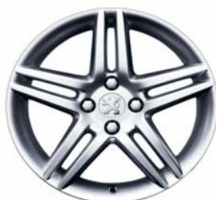
Jante alliage Stromboli 17"